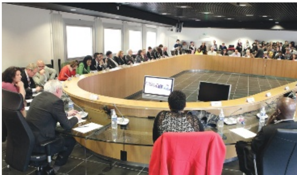
→ Les élus en actions lors des conseils municipaux.

De nouveaux élus et de nouvelles délégations au sein de la majorité municipale vont permettre de renforcer la proximité entre la municipalité et les Cergyssois.