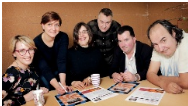
→ Une équipe qui ne perd pas le nord !

L'atelier des boussoles du Service d'accompagnement à la vie sociale (SAVS) de l'APAJH 95* prépare son magazine Déboussolés ? sur le thème des relations entre corps physique et corps psychique.