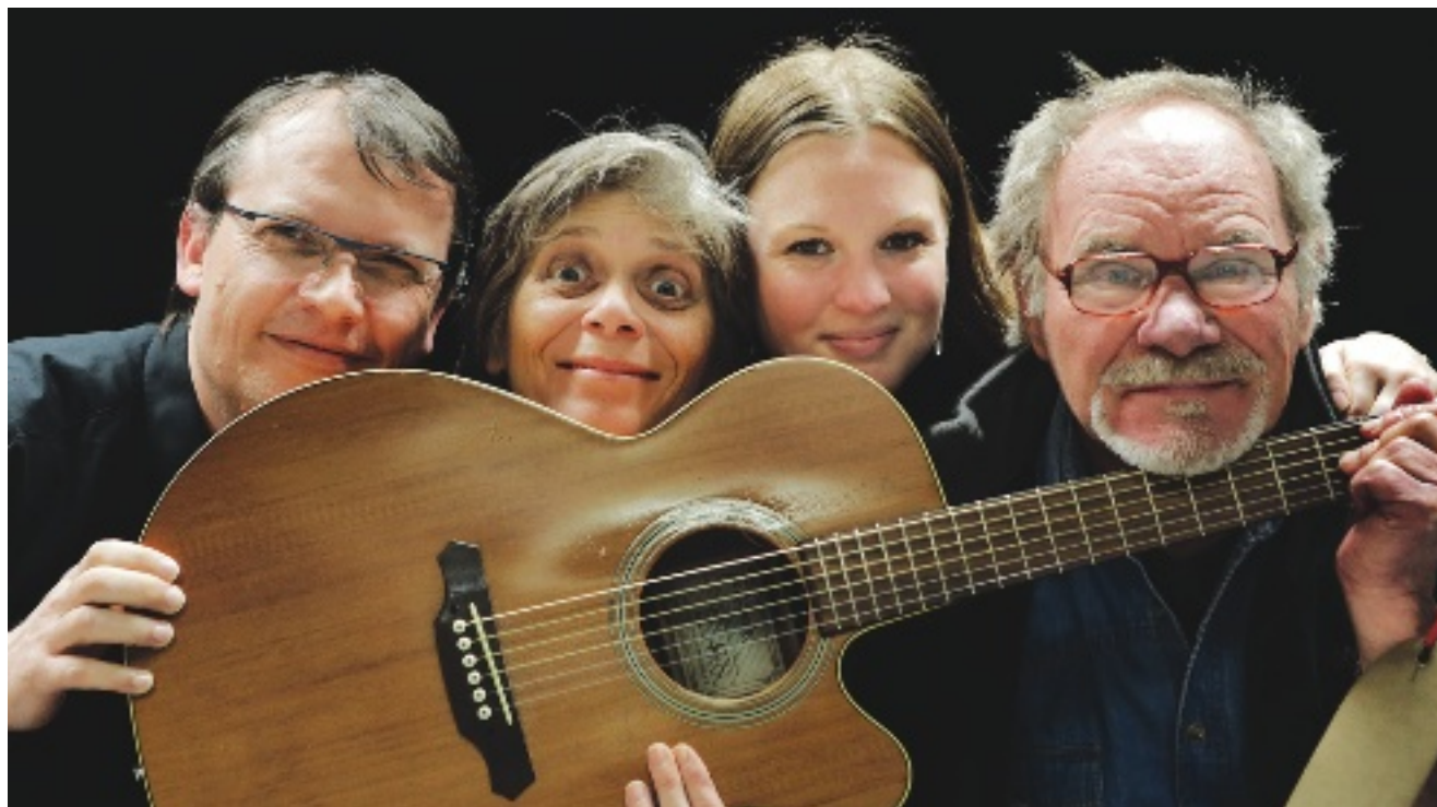
→ La bonne humeur est forcément dans les cordes de cette association de bienfaiteurs.

L'Essec a gagné deux rangs au classement du journal Challenges des écoles de commerces recrutant après une prépa. L'innovation pédagogique est un des points forts de l'école. En avril, l'Essec se distingue en ouvrant une chaire « Savoir-faire d'exception », en partenariat avec le château de Versailles.