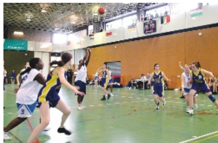
→ Le tournoi Quatuor se conjugue aussi au féminin.

Il suffit de former une équipe d'étudiants ou de Cergyssois âgés de 18 à 25 ans pour participer gratuitement au tournoi Quatuor, à la fois féminin et masculin. L'équipe qui terminera première dans chaque sport sera inscrite gratuitement au T5B. Rappelons que, l'an dernier, c'est l'équipe