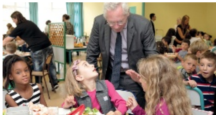
→ Échanges de goûts et de saveurs avec le maire.

eux-mêmes, depuis janvier, les formateurs des enfants dans chacune de ces écoles. Un atelier médiation est même développé dans le cadre de l'atelier citoyenneté des Périscolaires. L'objectif est d'identifier une dizaine d'enfants médiateurs par école qui seront reconnus et présentés en temps que tel aux autres écoliers. Cette forme de médiation, déjà en pratique dans les collèges et lycées cergyssois, pourrait être étendue à terme à l'ensemble des écoles de Cergy. ■