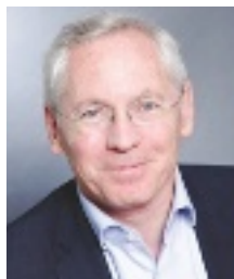
JEAN-PAUL JEANDON Maire de Cergy