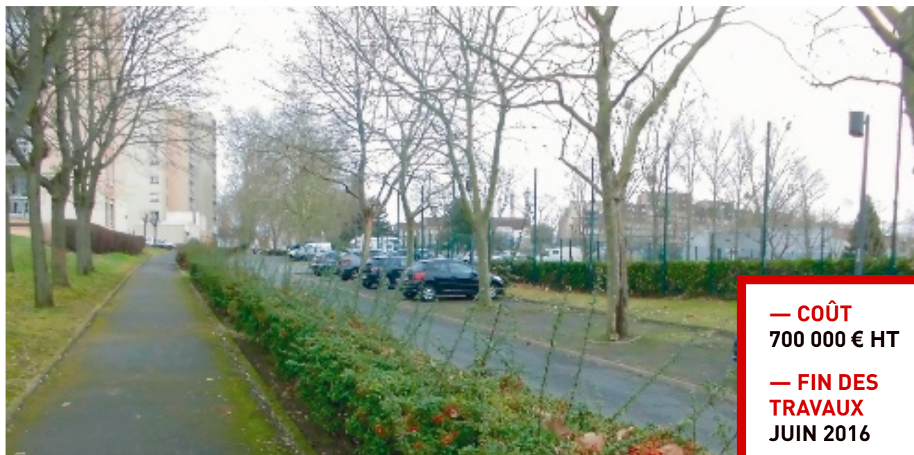
→ Justice Pourpre : la ville réhabilite le parking, la chaussée, les trottoirs, l'éclairage...

Dernière touche : le remplacement du patrimoine arboré par des essences plus adaptées au milieu urbain. Les différentes interventions menées par la ville sur cet axe ont pour but l'amélioration du cadre de vie des habitants et des commerces du quartier, en complément des aménagements du pôle gare.