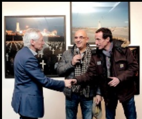
→ 15 janvier. Où Sommes-nous? Au Carreau, pour le vernissage de l'exposition du collectif Tendance Floue.