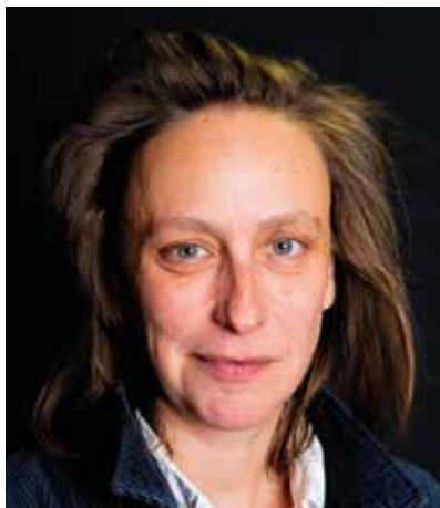
Céline SCIAMMA [Réalisatrice et scénariste]

Si Cergy était une femme, elle serait forcément une belle histoire, comme celles que Céline Sciamma sait si bien écrire et mettre en image. Ce serait le scénario idéal d'une enfant cergyssoise montant les marches du palais des festivals à Cannes. Le rouge du tapis ferait écho à la couleur emblématique d'une ville qu'elle « continue d'adorer ». « Cergy, c'est la ville de la couleur, la ville d'une mise en scène ; je sais où je dois regarder. Ailleurs, c'est plus compliqué, confiait-elle récemment, lors d'une rencontre avec Annie Ernaux. Ici, quelque chose ne tarit jamais, on peut tout inventer, et c'est précieux. » Aussi précieux que le prix du meilleur scénario au festival du film de Cannes qui vient de lui être décerné pour son dernier long-métrage, Portrait de la jeune fille en feu .