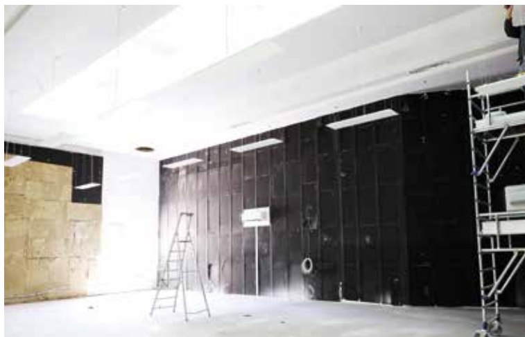
Salle de répétition et de restitution de l'École municipale de musique