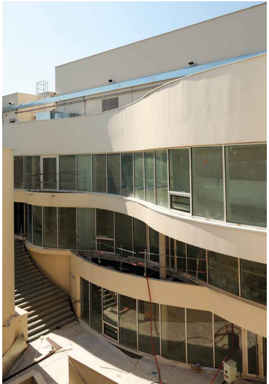
Studios et École municipale de musique vue du patio