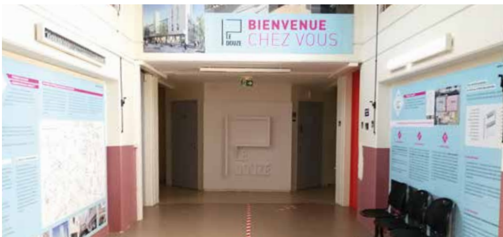
Maison du projet