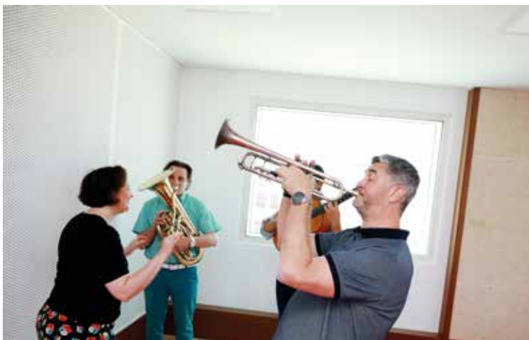
Salle de classe de l'École municipale de musique