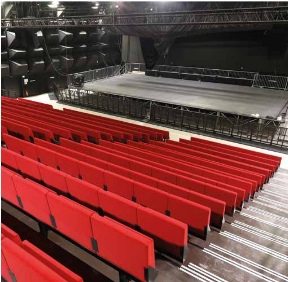
Salle de spectacle

Musique, toujours, avec la livraison imminente des locaux de l'École municipale de musique ainsi que des studios de répétitions et d'enregistrement. Leurs équipements techniques et le traitement acoustique ont fait l'objet d'une attention toute particulière, notamment pour que les riverains ne subissent aucune nuisance sonore. Comme pour la salle de spectacle, ses usagers bénéficieront donc d'un son d'exception. Avec l'équipe municipale, nous avons hâte de voir les Cergyssois s'approprier ce bel équipement structurant des quartiers Horloge et Axe Majeur.