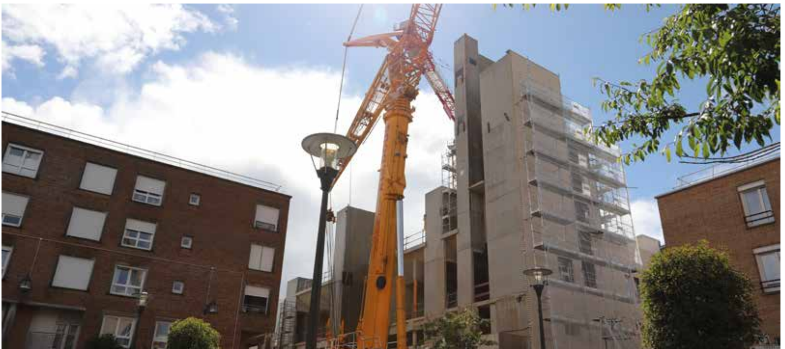
Démontage de la grue du douze