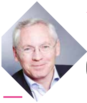
JEAN-PAUL JEANDON Maire de Cergy