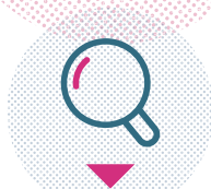
DÉVELOPPEMENT DE L'OFFRE D'ACTIVITÉS SUR L'ENSEMBLE DU TERRITOIRE