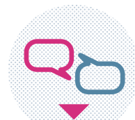
DIALOGUE QUOTIDIEN POUR AMÉLIORER LE CADRE DE VIE