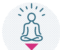
ACTIONS POUR LE BIEN-ÊTRE PARENTAL