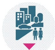
ANIMATIONS EN PIED D'IMMEUBLE