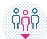
SOUTENIR LES FAMILLES SUR LES QUESTIONS ÉDUCATIVES ET DE SANTÉ